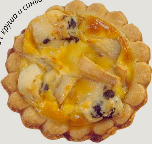
Киш с круша и синьо сирене