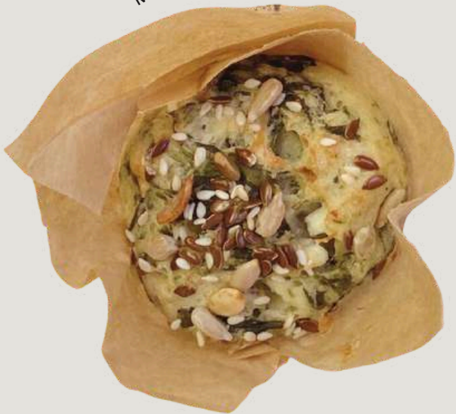
мъфин със спанак