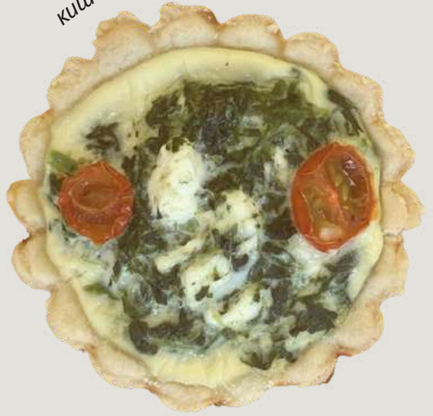
киш с чери домати