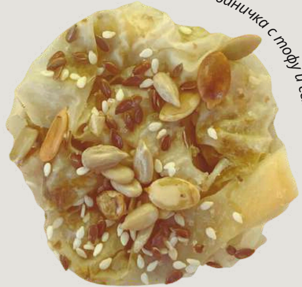
веган баницка с тофу и семки