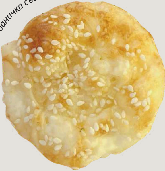
традиционна баницка със сирене и сусам